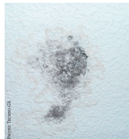
Traces de moisissure dans un local mal aéré