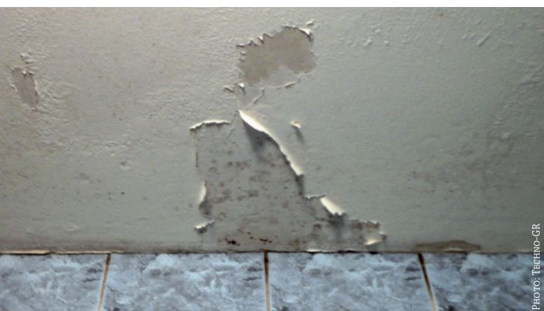
Moisissures dans une salle de bain